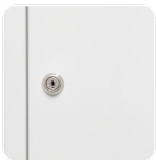
ZAMEK PATENT - BEZ OKIENKA

RADOM 26-600 Radom, ul. Sadownicza 6 tel. 48 363 89 98 e-mail: sprzedaz@supron.pl