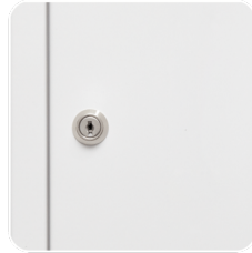
ZAMEK PATENT - BEZ OKIENKA

Przy dużej ilości szafek jednym kluczykiem można otwierać wszystkie szafki. Kluczyk umożliwiający awaryjne otwarcie jest umieszczony za szybką bezpieczną.